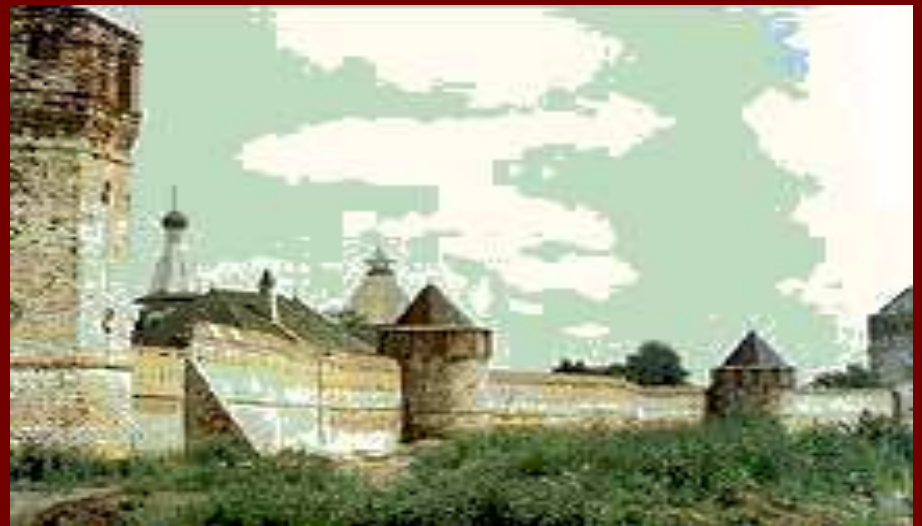
Спасо-Евфимиевский монастырь Место упокоения Дмитрия Пожарского