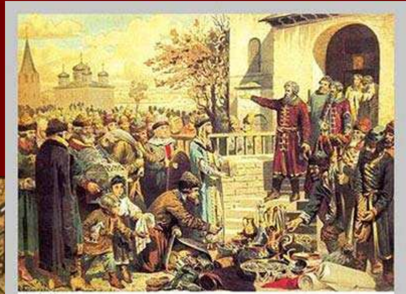
А.Д.Кившенко. Воззвание Кузьмы Минина к нижегородцам 1611 год