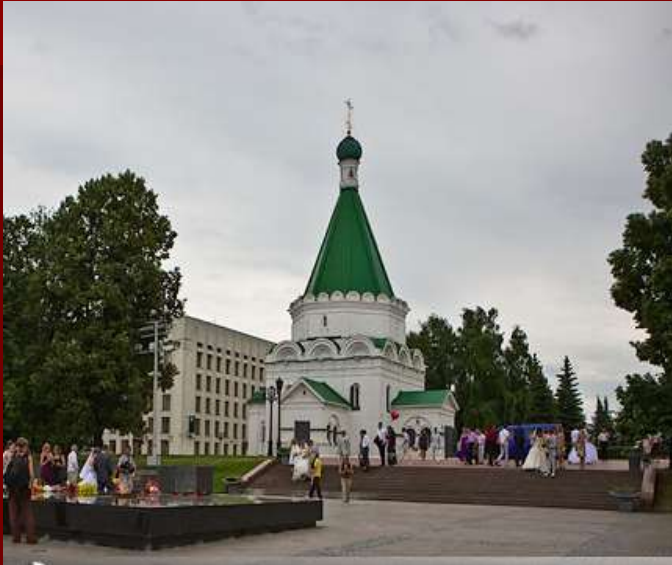
Михайло-Архангельский собор Место упокоения Кузьмы Минина