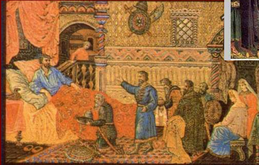
И.А.Фомичев. Призыв Минина к Пожарскому

По городам и весям понеслись грамоты от патриарха Гермогена с призывом к русскому народу постоять за православие и Отечество.