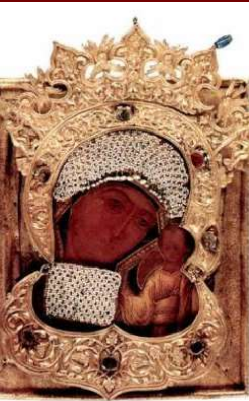
Икона Казанской Божией Матери

Перед ней молились Минин и Пожарский, она сопровождала ратников в походе.