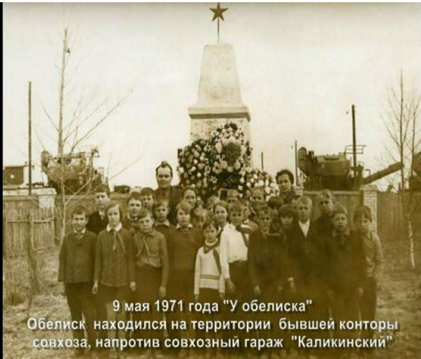
9 мая 1971 года "У обелиска" Обелиск находился на территории бывшей конторы совхоза, напротив совхозный гараж "Каликинский"